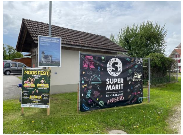
Event-Time (Foto 11.5.2023)