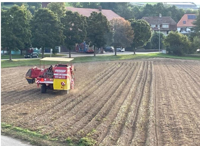
Kartoffel-Time (Foto 4.9.2023)