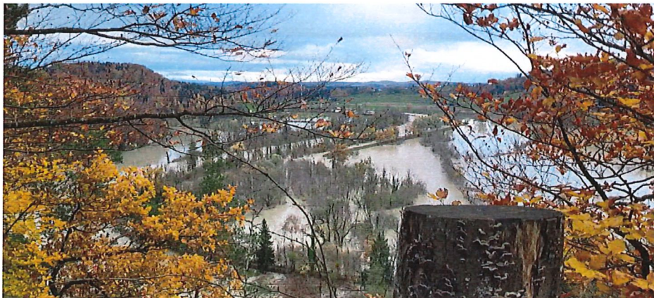
Unwetter Oltigen (Bild 15.11.2023)